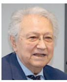
Pierantonio Muzzetto Presidente dell'Ordine dei medici.

«Mancano gli specialisti». Ha usato parole molto chiare Pierantonio Muzzetto, presidente Omceo (Ordine dei medici chirurghi e degli odontoiatri) di Parma e coordinatore della consultazione nazionale deontologica, durante l'assemblea ordinaria di metà anno, che si è tenuta nella sala convegni dell'ordine, in via Po.