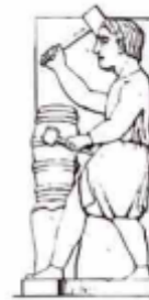
Associazione Parmense dei Medici del Lavoro

allegato di autocertificazione entro il 31 gennaio 2026 al Ministero della Salute e, per conoscenza, anche all'Ordine dei Medici cui si è iscritti (nel modulo allegato è indicato quello di Parma), corredato in allegato dello screenshot della pagina del sito con il riepilogo del completamento del previsto obbligo formativo del triennio 2023-2025, conservando copia della documentazione inviata per eventuali successive verifiche o richieste da parte delle aziende.