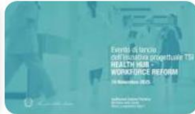
Ministero della Salute Ministero della Salute - Commissione...